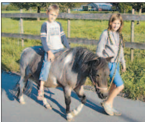
Bei der Schafausstellung können die Kinder auch Ponyreiten.

• Lustenauer Schafausstellung. Nähere Infos zum Rahmenprogramm und den verschiedenen Schafassen.