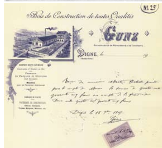
Oben (ci-dessus): La batteuse vers 1885, Die Dreschmaschine um 1885 - Papier à en-tête du d'but du XXe siècle, Briefkopf Anfang 20. Jahrhundert.